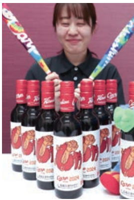
▲広島三次カープワインをPRする従業員

広島三次ワイナリーは2月1日、大好評の「広島三次カープワイン」を発売しました。地元球団の広島東洋カープを応援しよう!と15年前から商品化している赤ワインで、ボトルキャップには球団ロゴをあ