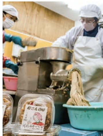
▲大豆をミンチにするメンバー

三次市の河内味噌グループは2月1日、4人のメンバーで米こうじ味噌の仕込み作業を行いました。味噌づくりは同グループで30年以上行なわれており、地元河内産の白大豆と三次産の米こうじを