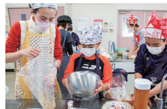
▲協力して味噌づくりを仕込む参加したメンバー

女性部三次地区本部フレッシュミズ部会は2月3日、毎年恒例の味噌づくりを行ないました。作業は1日～2日水に浸けた大豆を使用し、柔らかく煮たものを塩と米麴に混ぜる等部員らで協力しながら仕込み作業を進めました。完成したものは部員らの自家製の味噌としてそれぞれ家庭毎の味に仕上げ1年間熟成させます。材料は地元産のものにこだわりました。活動に参加した部員は、「皆で集まって楽しく作れた」「毎年この活動が楽しみ。ぜひ来年も参加したい」と話しました。